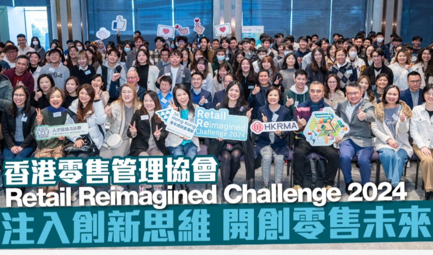
香港零售管理協會Retail Reimagined Challenge 2024 注入創新思維 開創零售未來

近年本港零售業面對激烈競爭，要突圍而出，必須注入創新思維，為業界帶來新動力、新發展。香港零售管理協會與青年成就香港部合辦「Retail Reimagined Challenge 2024」，旨在透過親身參與商業案例挑戰賽，讓年輕人體驗充滿活力和發揮空間的零售業。同時，學生又為零售品牌注入新動力及創意，推動業界與時並進。早前(1月27日)，協會舉辦了首場活動Retail Inspire，為挑戰賽揭開序幕，一眾參賽學生與業內資深業者愉快交流，為接下來的挑戰賽熱身。