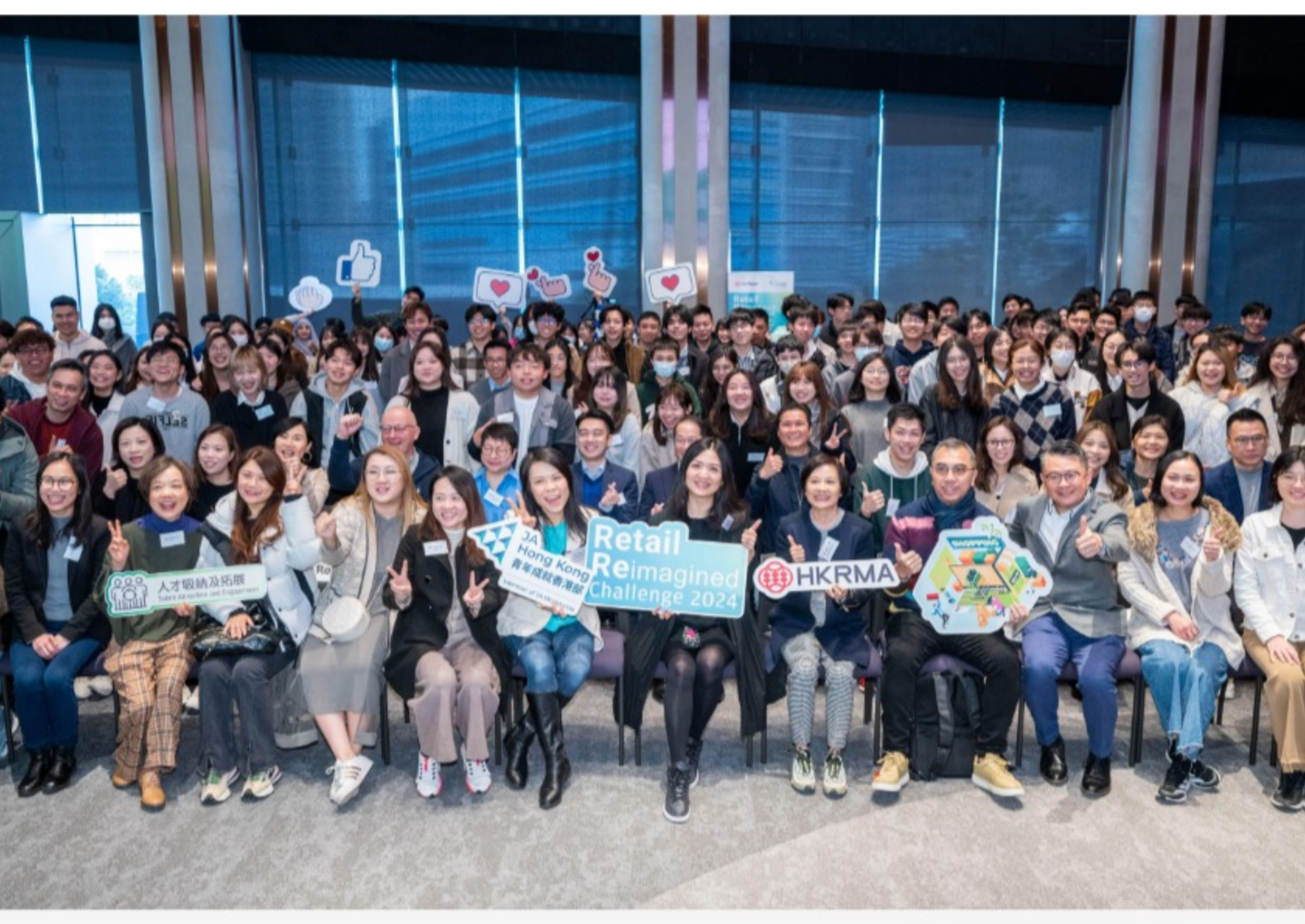
香港零售管理協會及青年成就香港部攜手舉辦「Retail Reimagined Challenge 2024」，挑戰賽於1月27日舉辦了Retail Inspire，為挑戰賽做好準備。

近年本港零售業面對激烈競爭，要突圍而出，必須注入創新思維，為業界帶來新動力、新發展。香港零售管理協會與青年成就香港部合辦「Retail Reimagined Challenge 2024」，旨在透過親身參與商業案例挑戰賽，讓年輕人體驗充滿活力和發揮空間的零售業。同時，學生又為零售品牌注入新動力及創意，推動業界與時並進。早前(1月27日)，協會舉辦了首場活動Retail Inspire，為挑戰賽揭開序幕，一眾參賽學生與業內資深業者愉快交流，為接下來的挑戰賽熱身。